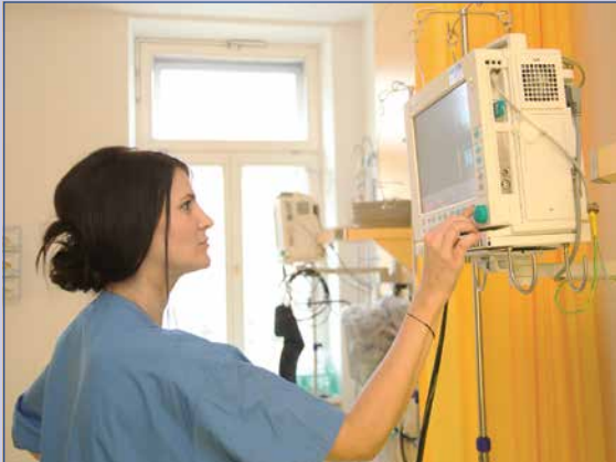
Aufwachstation neu: Zwei Betten können zu IMCU oder ICU im Anlassfall hochgefahren werden.