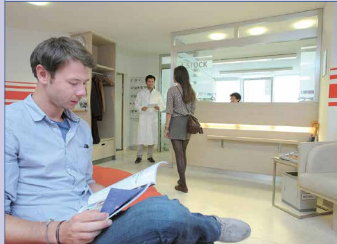
Im neuen Ordinationszentrum haben zahlreiche Top-Mediziner ihre Praxis.