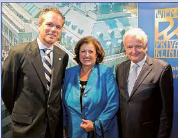
Ambassadors Cocktail: Die WPK bringt alljährlich Diplomaten und Belegärzte zusammen.